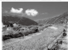
河津桜祭り (イメージ)