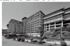
稲取銀水荘 (イメージ)

花の名所南房総の観光から始まり安房小湊宿泊。伊豆諸島最大の伊豆大島にジェット船でクルージングしながら向かい椿まつりをご覧ください。その後はプロが選ぶ日本の旅館ランキングの上位に常連の「稲取銀水荘」に宿泊して頂き、河津桜まつり、熱海梅まつりと見どころ満載の3日間です。